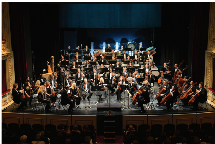
Εθνική Συμφωνική Ορχήστρα

Δυο συνεχόμενες χρονιές συνεργαζόμενος αρχιμουσικός σε παιδικές παραγωγές της ΕΛΣ, σε παραγωγές του όπερα στούντιο της ΕΛΣ αλλά και στη Σύγχρονη Όπερα της ΕΛΣ. FM, Libra, Magni, Mercury/Universal, Aristotelian University Studio και ανεξάρτητες παραγωγές.